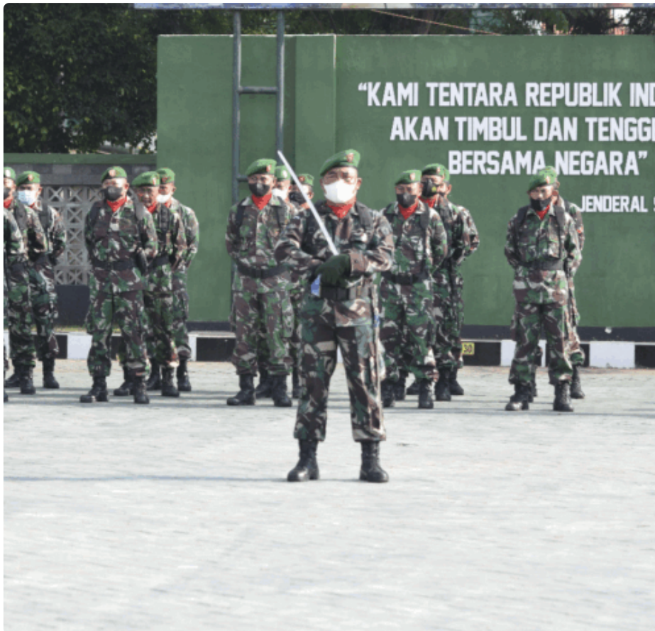
Upacara yang diikuti oleh seluruh anggota prajurit dan PNS jajaran Kodim 0811